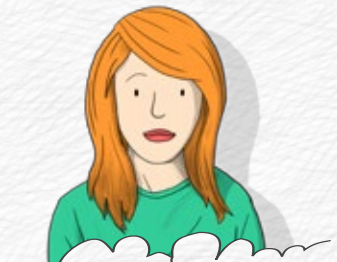
GIULIETTA LA PARTY-QUEEN