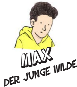
MAX DER JUNGE WILDE