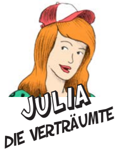
JULIA DIE VERTRÄUMTE