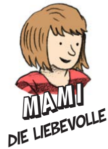
MAMI DIE LIEBEVOLLE

Willkommen in unserer ganz normal verrückten Familie. Wir reden Klartext, wenn's ums Internet geht. Denn da tummeln wir uns genauso, wie viele andere Familien - und wie viele Gauner, Grusel und andere dunkle Gestalten auch. Führt euch also unsere Geschichten zu Gemüte. Auf dass eure Exkursionen ins Internet nicht plötzlich arg aufs Gemüt schlagen oder aufs Portemonnaie drücken!