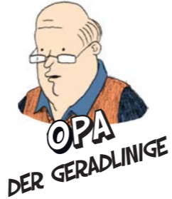
OPA DER GERADLINIGE