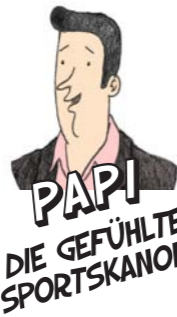
PAPI DIE GEFÜHLTE SPORTSKANONE